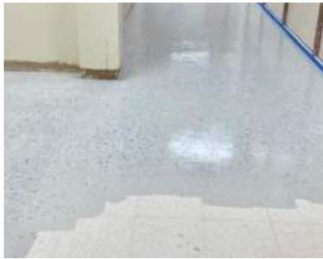
Aplicando a Cor de Base & Color Chips