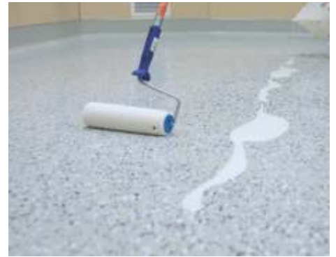
Aplicando o Revestimento Transparente