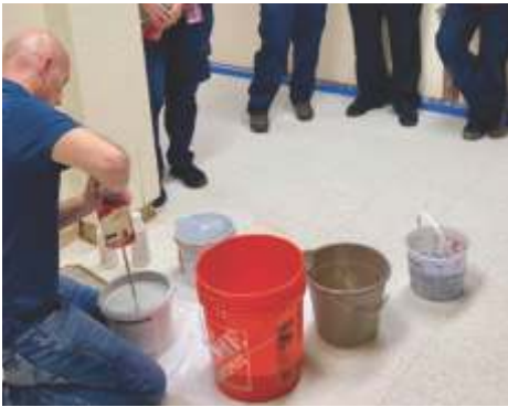
Misturando a cor